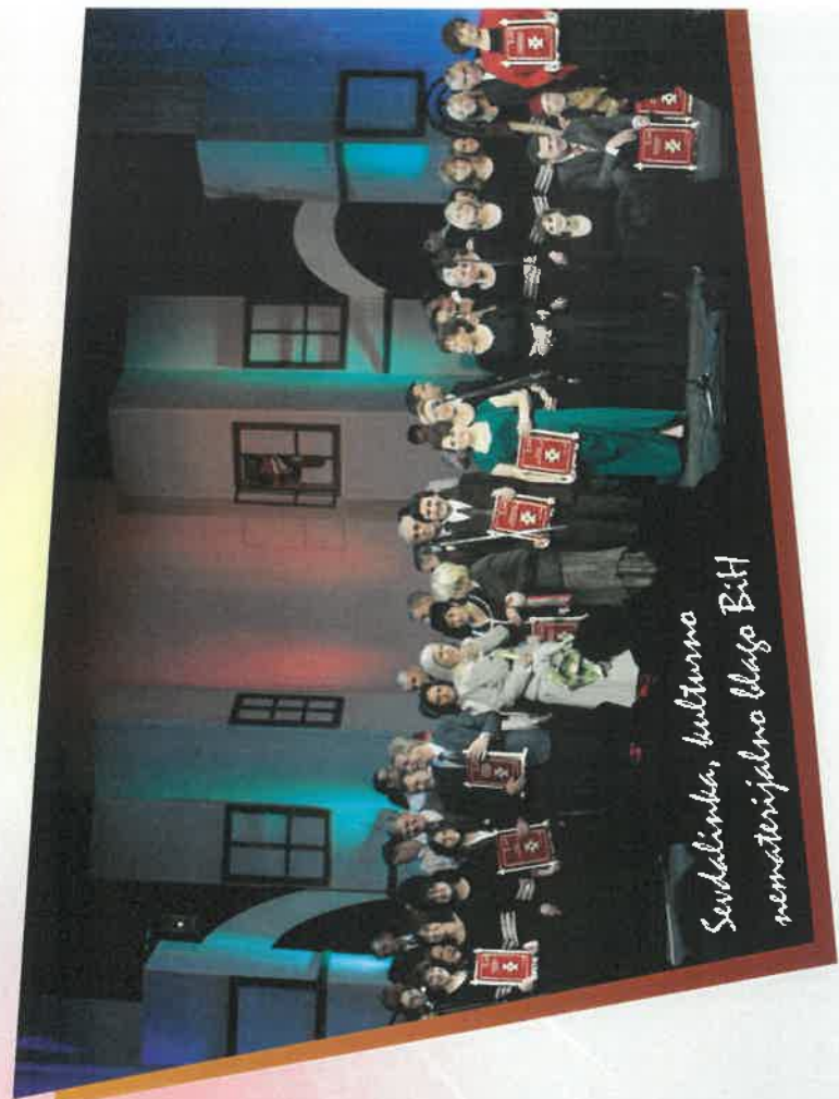
Sudalinka, kulturno nematerijalno blago BiH