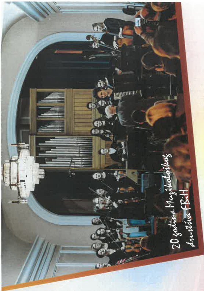
20 godina Mužičarstva društva FBiH

Ovaj sastanak je bio izuzetno važan korak pred razmatranje kandidature AMUS-a za prijem u stalno članstvo krovne organizacije autorskih društava.